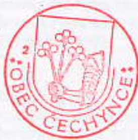
Vendelín Száraz Starosta Obce Čechynce