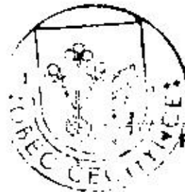
Róbert Kúpeček starosta

ZÁPADOSLOVENSKÁ VODÁRENSKÁ SPOLOČNOSŤ, a.s. Sídlo: Nitra, Nitra, Nestranská ulica 1 Západná Vrata, 260 02, 261 01 53 M IČO: 36 69 10 01 PRÍSL. ZODP. ZA SPRÁVU IČO: 36 69 10 02